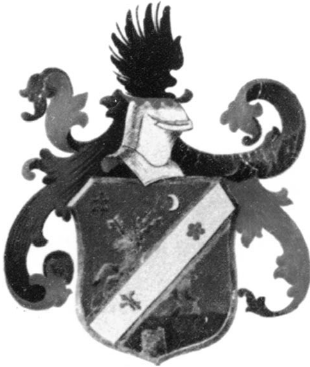
Az Ibrányi család címere