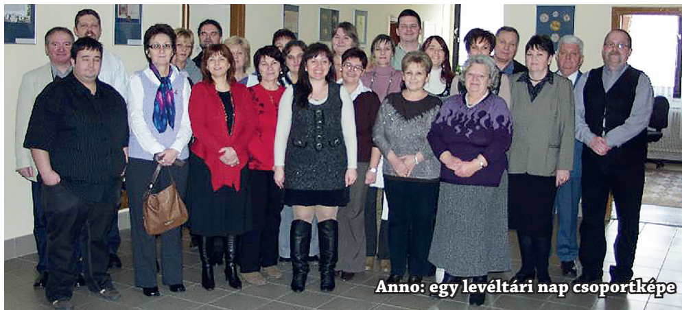
Anno: egy levéltári nap csoportképe

tünket, de ha úgy érezzük, hogy azt csináljuk, amit szeretünk, amiben jók vagyunk, akkor kit érdekel a divat? Én úgy gondolom, akkor kit érdekel a divat? Én úgy gondolom, akkor kit érdekel a divat? Én úgy gondolom, akkor kit érdekel a divat? Én úgy gondolom, akkor kit érdekel a divat?