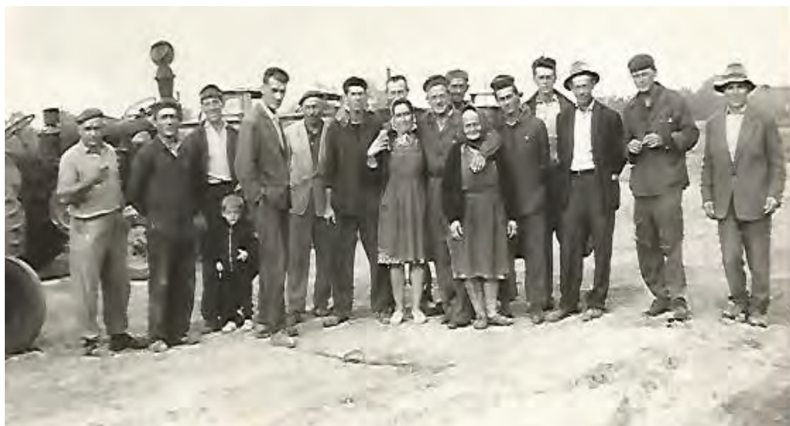
/Indulnak a gépek...A szerelő brigád.../

1974.január 1-én egyesült: a Tiszaadonyi Zöldmező Tsz