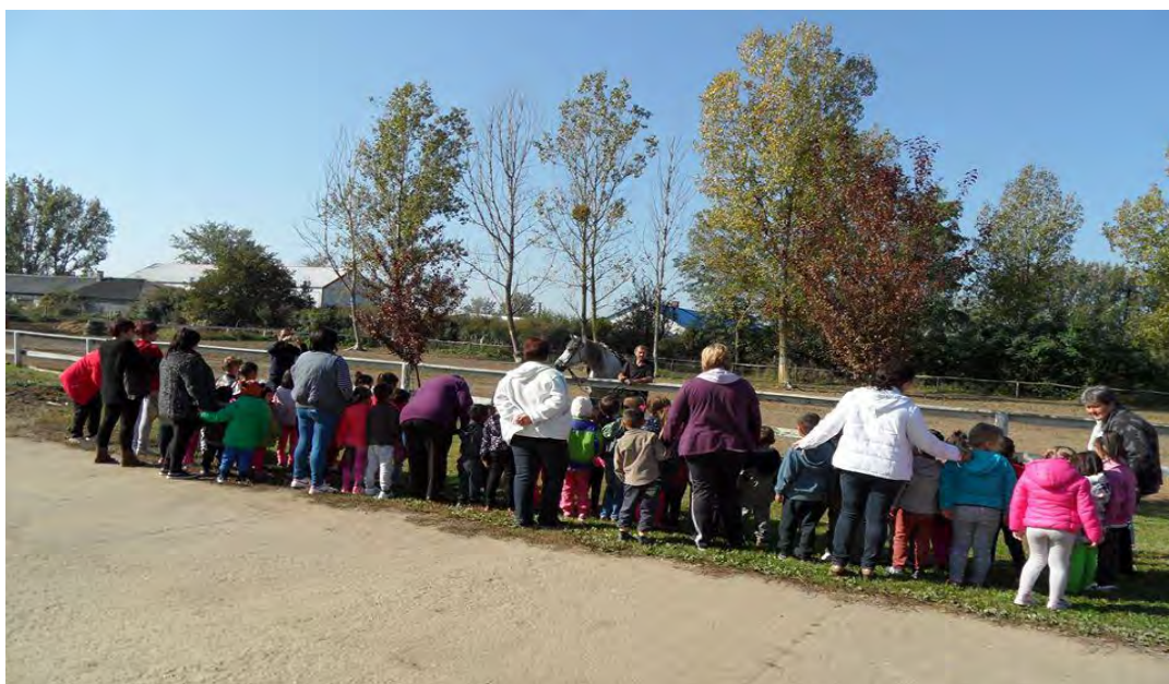
A tiszadonyi óvodások látogatása a Kapi Lovastanyán