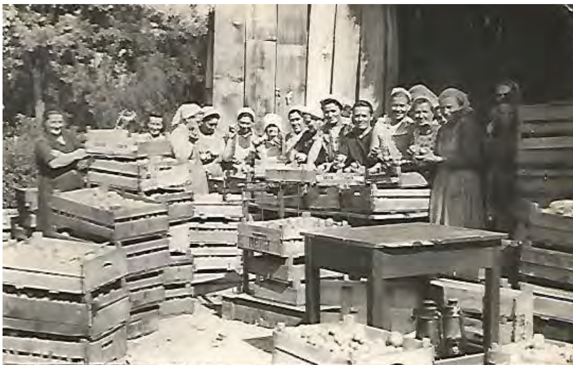
/Az asszony brigád a saját termésű Jonatán almát csomagolja exportra/