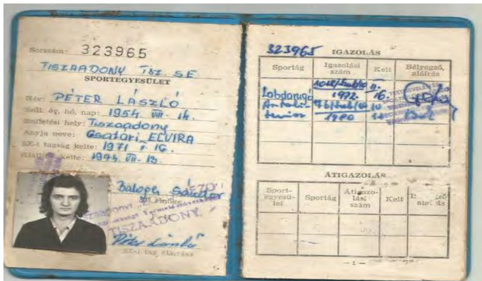
A Tiszaadonyi Tsz SE játékos igazolása

A sport támogatása: Saját futbalcsapat fenntartása