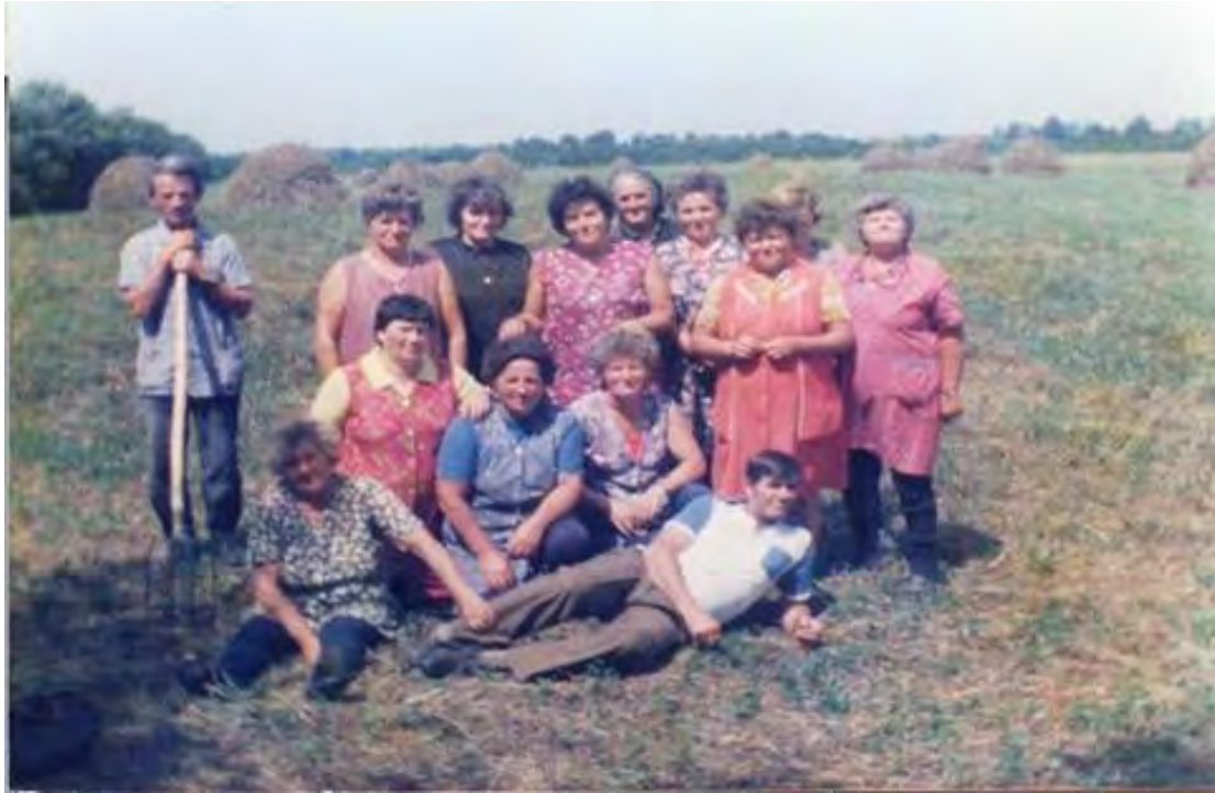
/Déli pihenő széna boglyázás közben /

1979-ben: 370 db szarvasmarha, 5 000 anyajuh, 600-700 ezer csibe, 35-40 ezer liba állomány volt.