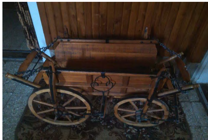
/Simon Mihály munkái: A termelőszövetkezetben használt lovas szekér kicsinyített mása. A valódinak mindenben részletében megfelel./