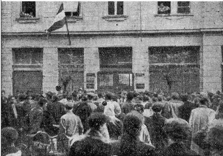
Támadás a nyomda ellen