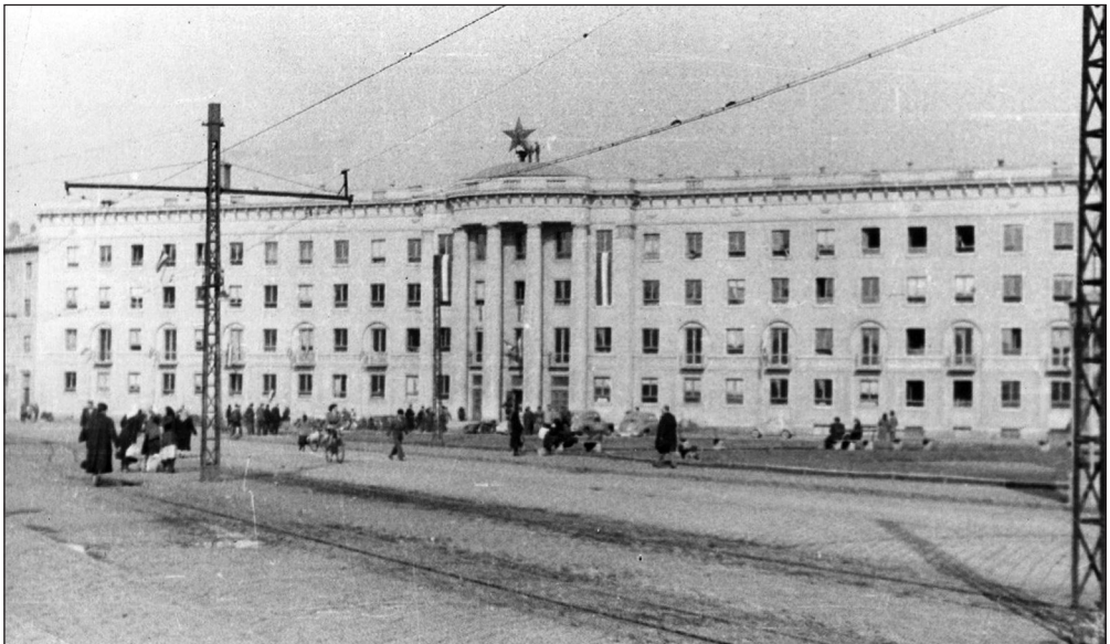
3. sz. ábra 17

A nyíregyházi fotósorozat „eredeti” jelentése, tudniillik az, hogy milyen célból készültek a képek, homályban marad, még hozzá azért, mert a felvételek készítőjét (készítőit) nem ismerjük. Nagy merészség persze nem kell ahhoz, hogy kijelentsük: a fényképezőt minden bizonnyal a megőrkítés, a dokumentálás szándéka vezette. És ha ez így volt, akkor kijelenthető, hogy már a legelején tisztában volt azzal, hogy jelentős, megőrkítésre érdemes eseményeknek vált a szemtanújává, már akkor, amikor észlelte az irodaházon lévő vörös csillag leszerelését (vagy amikor értesült róla valakitől, és azért sietett a helyszínre). Pedig akkor még kevesen voltak a téren, néhányan bámszkoztak csak, ám – a fotók tanúsága szerint – kis idő múlva már viszonylag jelentős tömeg gyűlt össze.