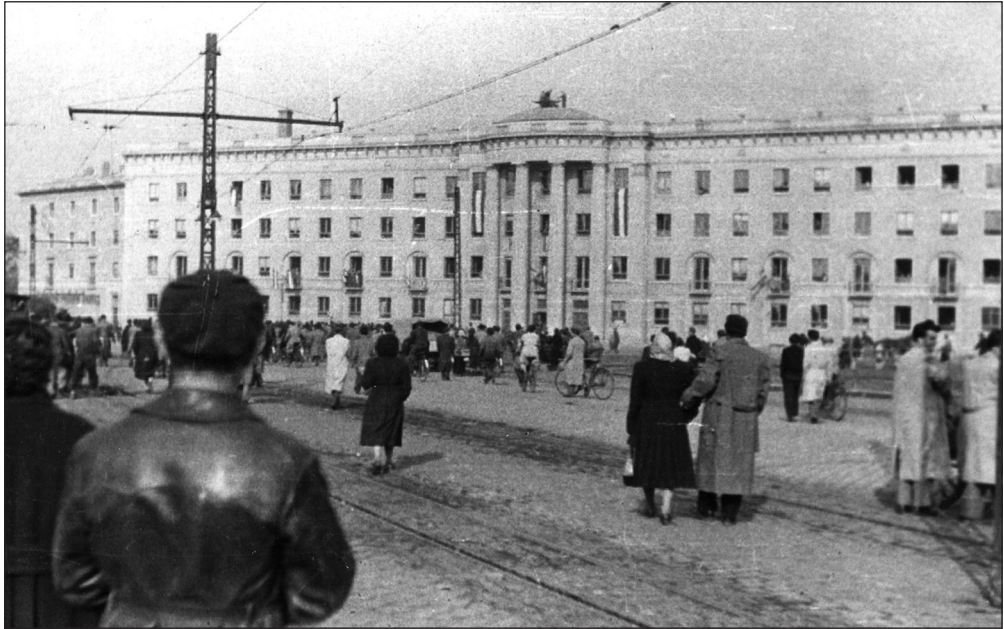
4. sz. ábra 18