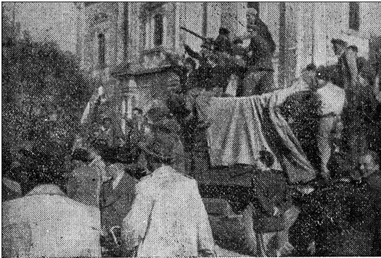
A nyomda és a rádió ellen szerveznek támadást