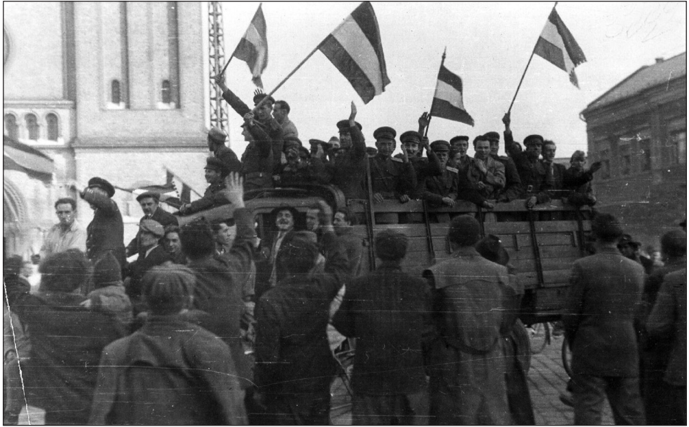
6. sz. ábra 42

Azt, hogy miként változhat meg ugyanazon kép jelentése a kontextustól függően, egy konkrét fotó példáján mutatom be.