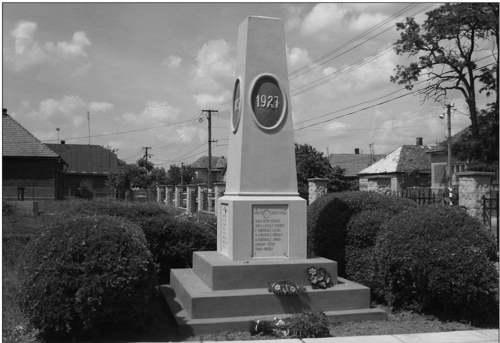
Az I. világháború áldozatainak emlékműve a somi templomkertben