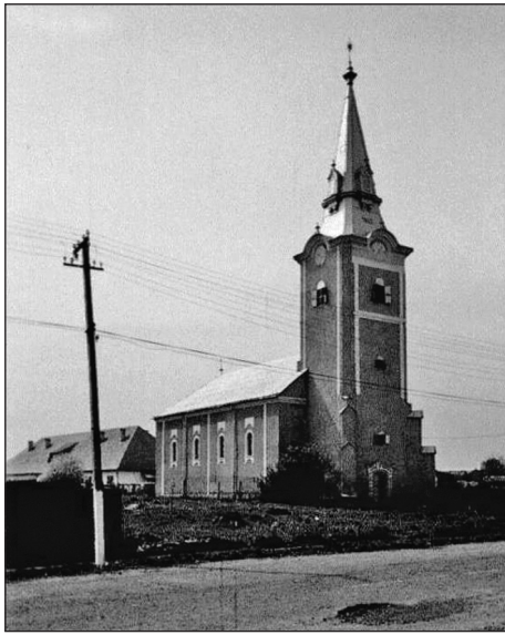
A somi református templom (A szerző felvétele)

négy oldalról keretelt-zsalugáteres ablakok díszítik, amelyeket a sarkoknál függőlegesen végigfutó, szürke alapokon nyugvó fehér vakolatdísz tesz látványosabbá. A toronyóra hely fölött a szögletes, kúpos formájú sisak ívelten indul a templomfalról, közepét párkány töri meg ablaknyílásokkal. A templom hegyében található tüskés gombon egy szét-tárt szárnyú kakas látható. A sík famennyezetű hajó két végében faoszlopok tartotta karzat épült, amelyet az oszlopfőkön és a mellvéd alján fűrészelt fadíszítés szegélyez. A mellvédet piaszterek 8 tagolják, közeikben csúcsíves díszítés található. Az orgona neoklasszicista, aranyozott díszítésű. A Mózes-szék egyszerű felmagasodó háttámlája timpanonnal zárt. A fából készült szószék ugyancsak csúcsíves díszítésű, a szószék-korona sokszögű párkányon nyugvó, bordás