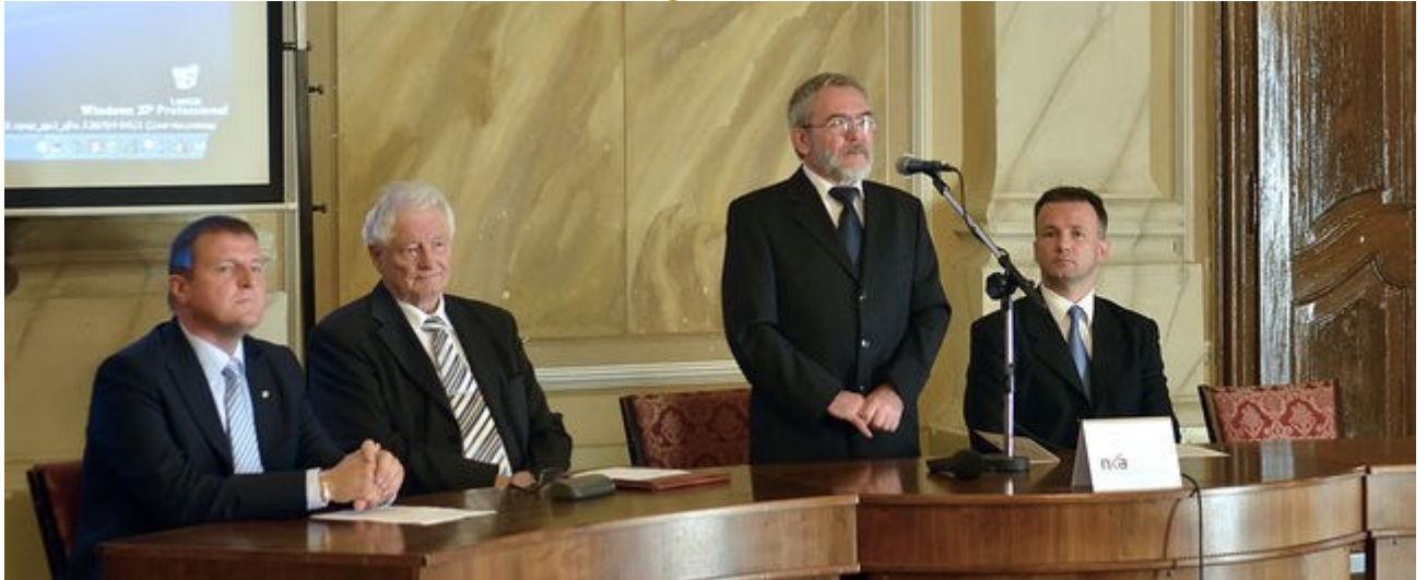
Levéltári konferencia a gyulai városházán.

A gyulaiak a török hódoltság időszaka előtt számos kiváltsággal rendelkeztek GYULAI HÍRLAP • S. E. • HÍREK • 2014. szeptember 22. 17:00