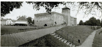
Az 1566 nyarán Gyula kálváriai helyzetét jól jellemzi, hogy a területen harmincezer török állt szemben a kevesen-egyszer védőkkel.

TÖRTÉNELEM Csak a téglavár maradt meg a védők kezén 1566-ban