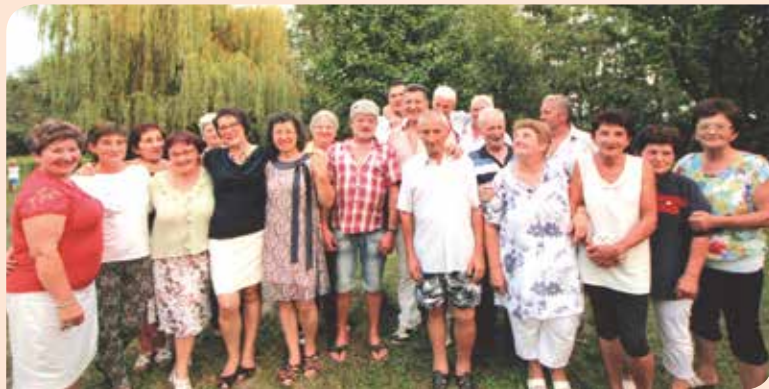
Unokatestvéri találkozót tartott a Bakó család, augusztus 5-én.