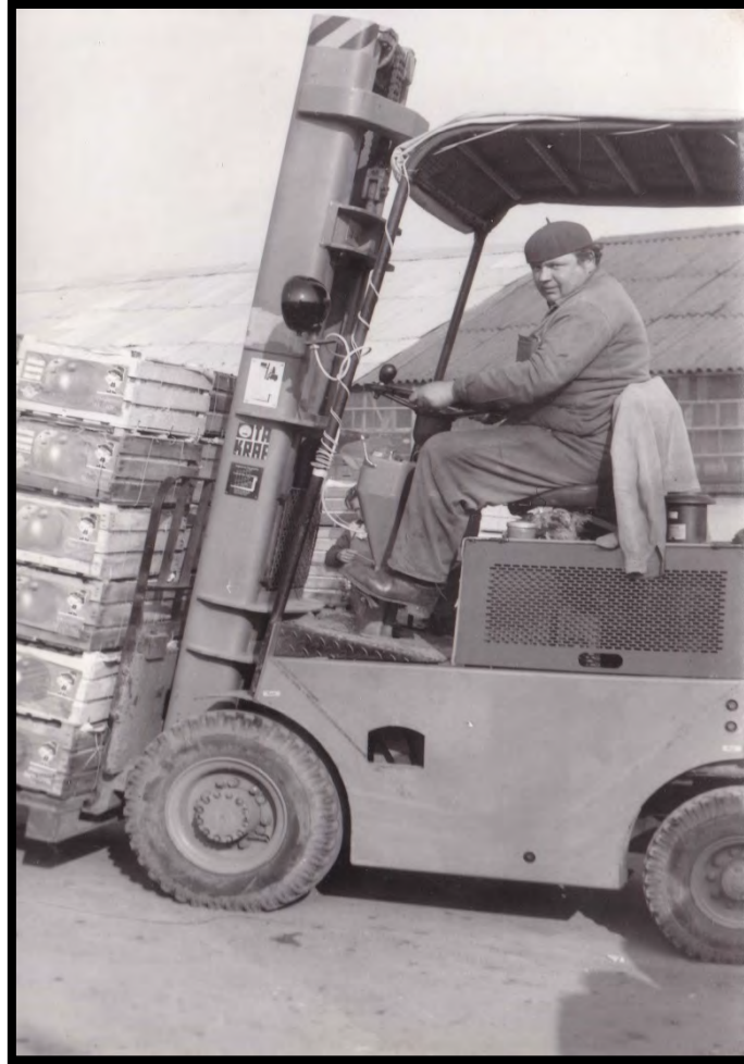
Téeszbeli pillanatkép papóval

Papó dicsérte a téeszeket is, azt mondta, hiába agitáltak 1960-ban a téeszésítés ellen, megérte belemenni, hiszen az új rendszer rengeteg embert jutatott különféle lehetőségekhez, beleértve azokat is, akik mai szemmel nézve igen alacsony szintű képzettséggel rendelkeztek. Az állam hatalmas összegeket fektetett a mezőgazdaságba, ritka volt az egyéni gazdálkodó, de ez Sényőn senkit sem zavart, mindenki élte a maga kis életét, ami sokkal jobb és tartalmasabb volt, mint a mai. Sényő a Kádár-korszakban gazdag falunak számított, hiszen krumplit és paszulyt termeltek, és ahogyan nekik is, mindenki másnak is volt tehene, ezáltal tej, vaj, túró és tejföl is került az asztalra. Mi ma már hírből sem ismerjük ezeket a házilag előállított, vegyszer- és adalékmentes finomságokat. A falu fejlettségét az is jól mutatta papó szerint, hogy 1962-ben már volt villanyáram. Ez természetesen nagy örömmel számított. Az élet könnyű volt Sényőn, mert itt volt a vízügy és az útfenntartó telephelye is, tehát létezett más munkalehetőség a mezőgazdaságon kívül is. Manapság szinte már csak a közmunka keretei között dolgozhat, aki tud... A munkások minden nap kaptak fizetést, számunkra szintén ismeretlen módon: kézbe