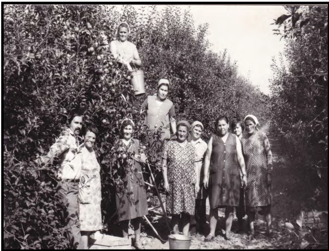
Munka a téészen

Mindegy volt, kinek a fia vagy a lánya, kinek a felesége volt a munkavállaló, szép volt, vagy épp csúnya, kövér, esetleg sovány, tanult vagy betanításra szoruló, húszévnnyi tapasztalattal rendelkező vagy az iskolapadból épp kiszálló pályakezdő... Pont ezek miatt a tapasztalok miatt nem értették öregségükre mamámék, mi folyik a megyében, az országban, és talán a világban is. Értetlenül álltak az előtt, hogy én mint diplomás unoka hogy nem állok a végzést követően azonnal a katedrára, miért vagyok egyszer iskolatitkár, másszor miért tüsténkedek rendezvényterazon, aztán hogyan kerülök két év alatt két középiskolába egyszer angol-, majd történelemtanárként. Már nem érte meg sem nagypapám, sem ő, hogy beléptem a seregbe... Mert ők abban éltek le mondhatni egy teljes életet, hogy a pap, az orvos, a tanár urak, akik megérdemelten állnak a ranglétra tetején, megérdemelten fordulhatnak hozzájuk tanácsért a falubeliek. Ők az elit, ők a vezetők, akikre fel kell és lehet nézni, és akik intelligenciájuknak és rátermettségüknek köszönhetően vezetik és képviselik például a kis Sényőt is. Jaj, fiam, mi lesz veletek, sopánkodott oly sokszor.