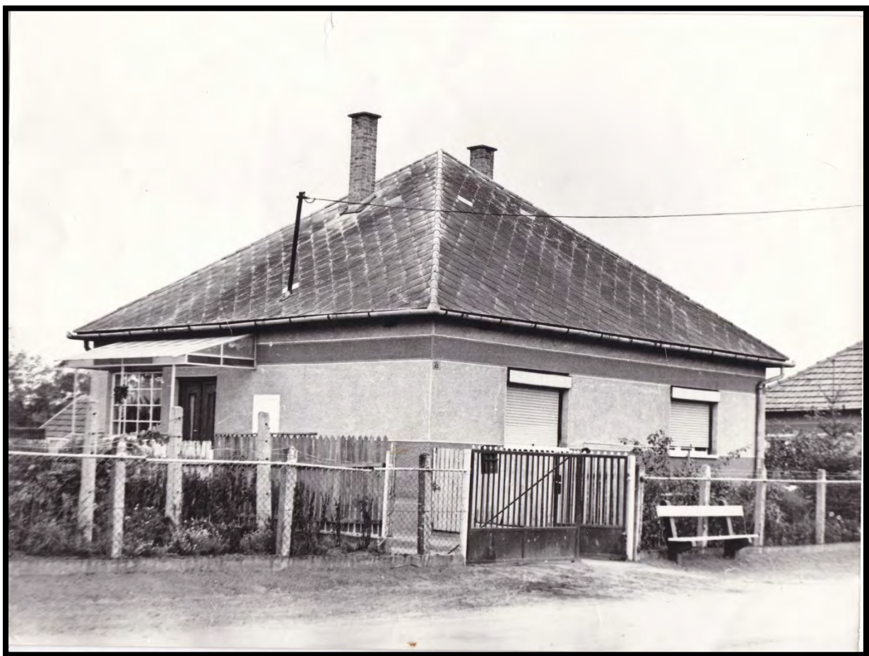
Édesanyám szülőháza a Rákóczi utca 42. sz. alatt

Éppen ez volt a Kádár-rendszer legfőbb eleme: az egyszerűség, a letisztultság, az egyformaság. Mindez azért is tetszett a nagyszüleimnek, mert nem igazán érezték, hogy ki szegény, ki gazdag, ki parasztember, ki tanár, mindenki ugyanazt ette, itta, ugyanazt a ruhát viselte, mint a másik. Édesanyám sokszor emlegette, hogy ugyanolyan ruhában járt középiskolába, mint a legtehetősebb családból származó osztálytársa. Nem érezte senki, hogy bármiben is kevesebb volna, mint a tévészelnök gyermeke vagy felesége. Diszkrimináció? Ezt a fogalmat sem ismerték az én nagyszüleim. Mint a kommunizmus minden egyes eleméről, arról is örömmel beszéltek, hogy a munka dicsőség és öröm volt, nem úgy, mint manapság. Nem is értették, a munkást miért nézi le a főnöke, miért nem fizeti ki időben, vagy miért nem vesznek fel valakit dolgozni, mert idősebb vagy mert kisgyermekes szülő. Hiszen akkor, amikor ők papóval összeházasodtak, és amikor édesanyám született, kifejezetten örültek a családalapításnak: még arra is tisztán emlékeztek, hogy 1966-ban, amikor anyukám született, 300 Ft volt a családi segély összege. Ez – szerintük – az akkori viszonyokat figyelembe véve egész szép fizetségnek minősült.