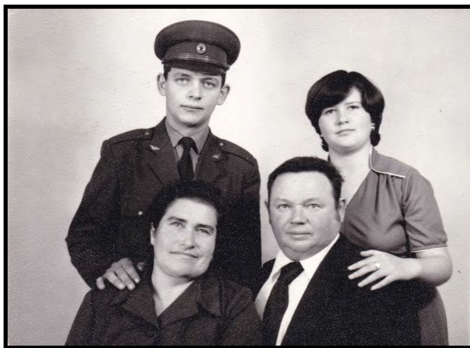
...és a '80-as években