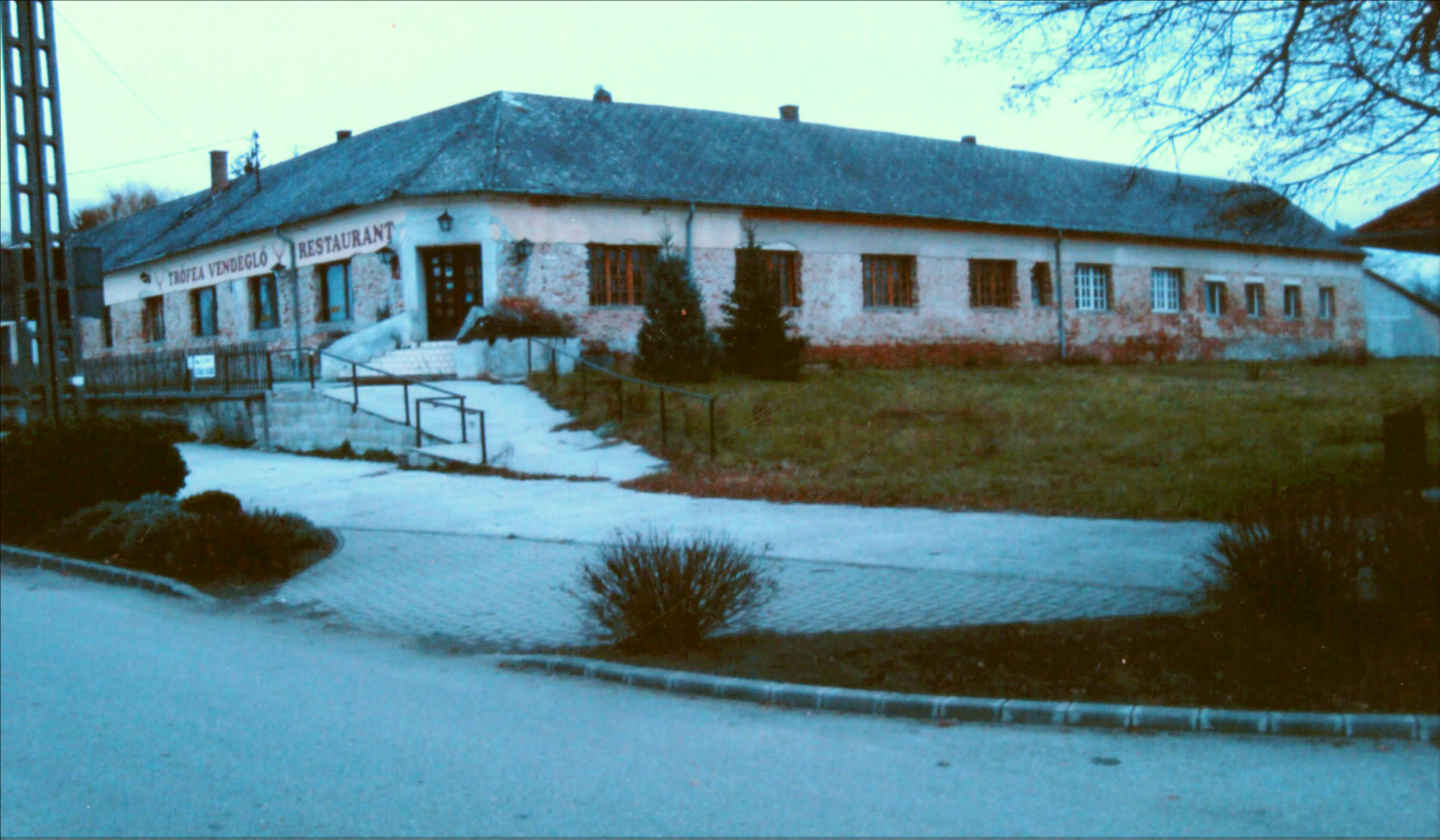
Az egykori Esterházy nagyvendéglő épülete Lovászpatonán