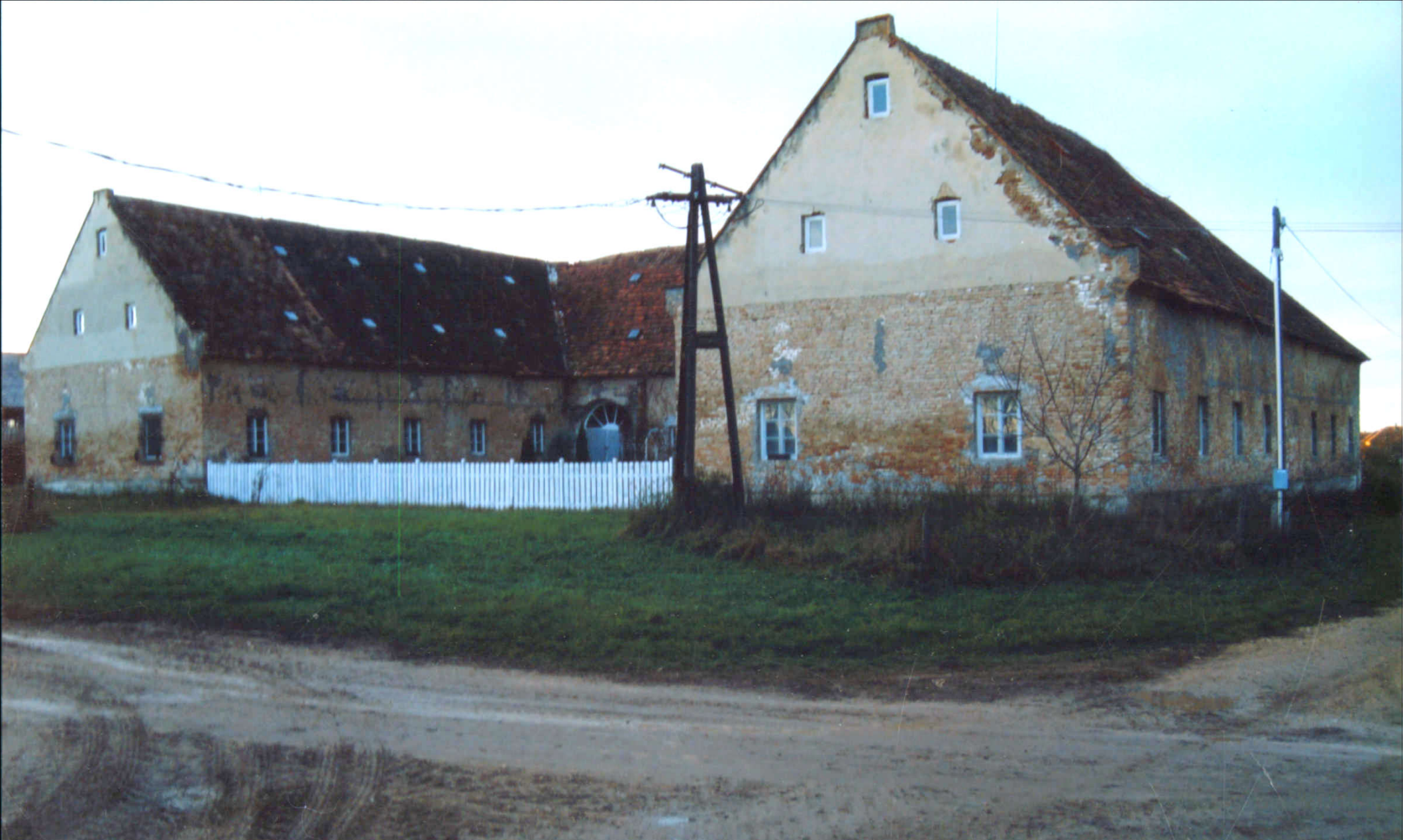
Az Agy majori nagy marhaistálló, két szintes padlóssal, Lovászpatonán