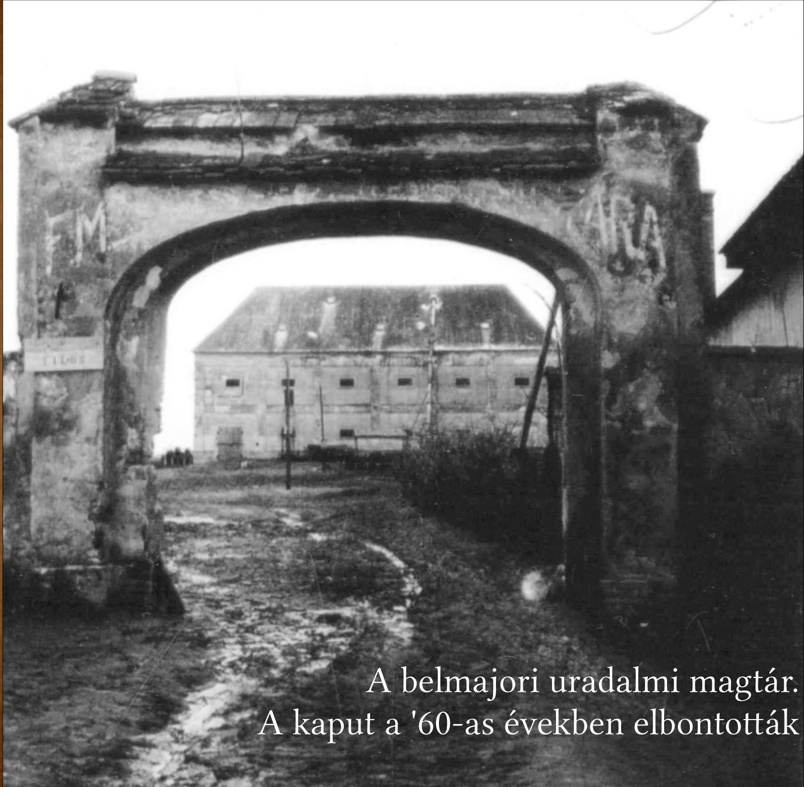
A belmajori uradalmi magtár. A kaput a '60-as években elbontották