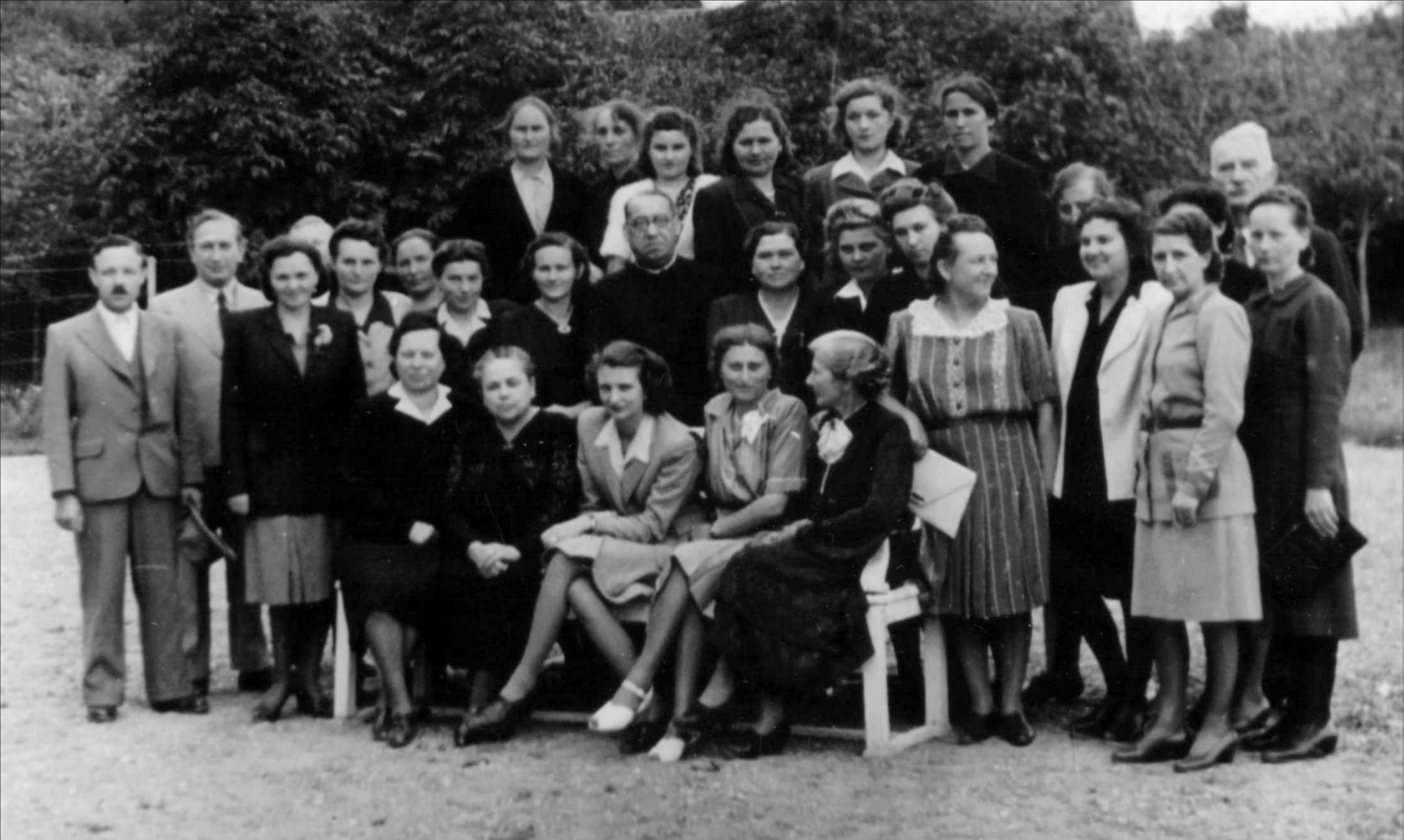
Csoportkép a patonai kastély előkertjében „Női bajtársak 1943. szeptember 15.”