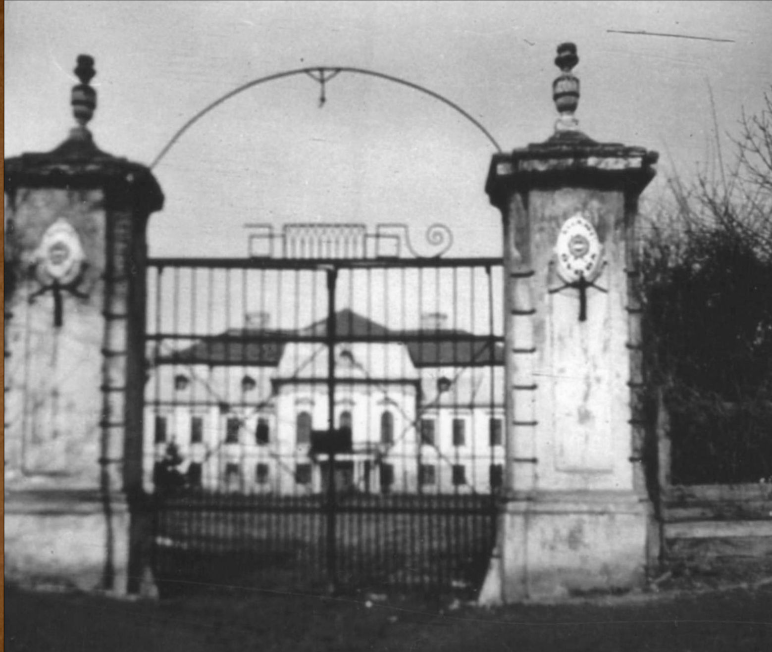
A kastély bejárata az 1960-as évek közepén