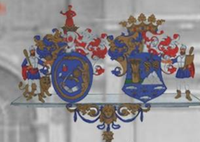
Hajdú-Bihar Megyei Önkormányzat